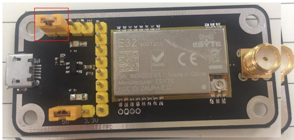
如图所示，插接好跳线帽（选择 5V 供电，模式 2），具体功能请参相应的串口模块手册。